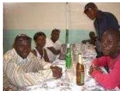
La délégation guinéenne